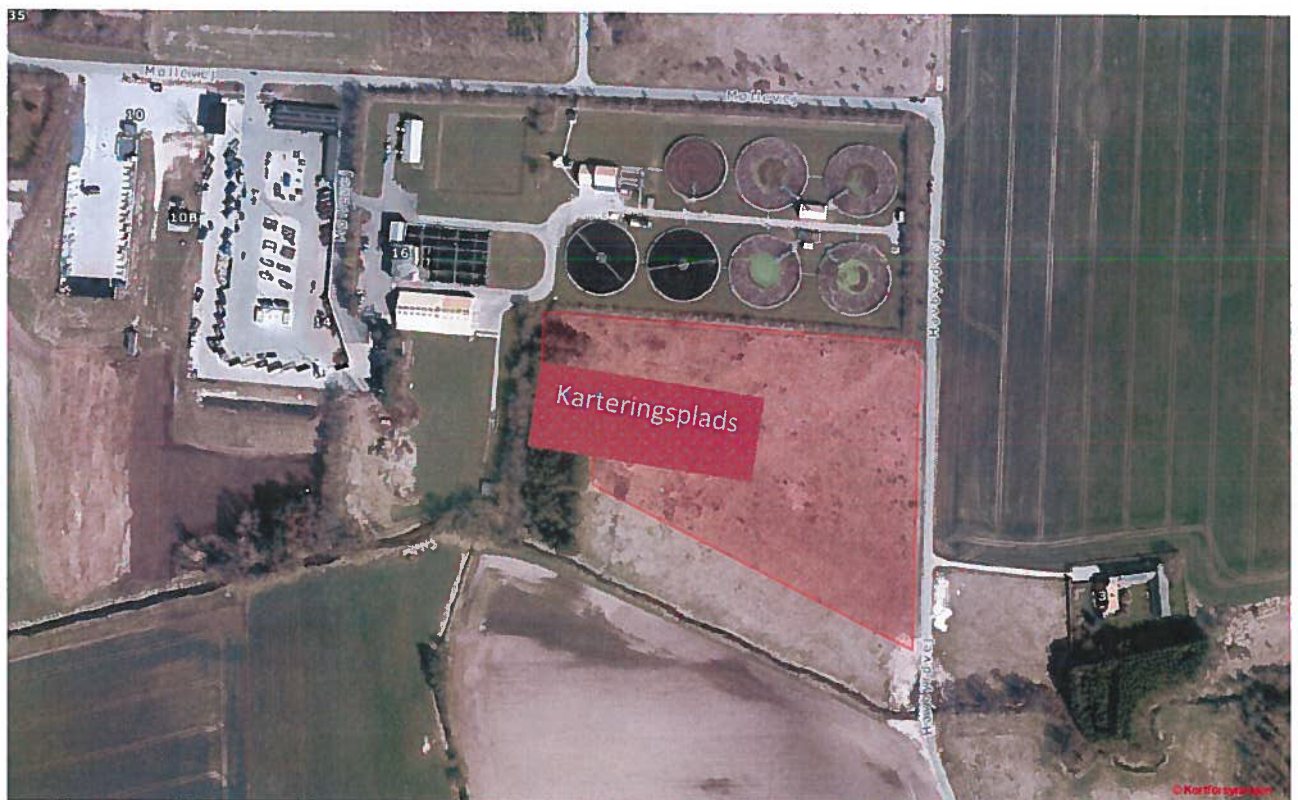
Kort der viser område hvor der kan terrænreguleres, og hvor karteringsplads ønskes anlagt.

3. juni 2017 er fremsendt bilag 5, anmeldeskema jf. Bek nr. 1832, "Bekendtgørelse om vurdering af visse offentlige og privates anlægs virkning på miljøet i medfør af lov om planlægning". Ringsted Forsyning har 27. juli 2017 modtaget svar fra Ringsted Kommune om, at der ikke er VVM pligt i forbindelse med terrænreguleringen af området.