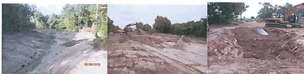
Nygravet vandrende efter regn, byskoven