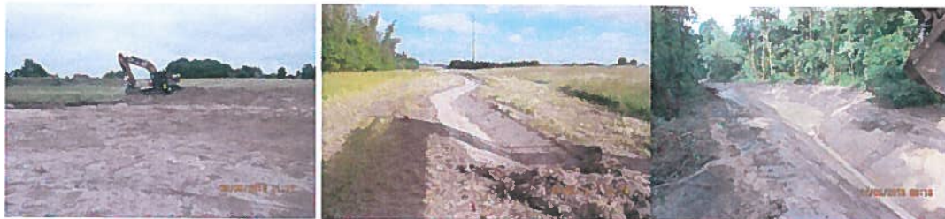
Rydningsarbejde i parken

Forventet afslutning fastholdes til juni 2017.