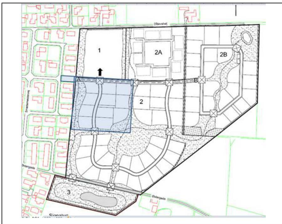
Udsnit af kort fra lokalplan 203

Regnvandsanlægget skal udover detailkloak til de 11 grunde indeholde, større afskærende ledninger frem til bassin syd for Østergade (delområde 3), bassin og udløb herfra til den rørlagte del af Ortebækken. Desuden bliver der mulighed for at aflaste pumpestationen på Smedemestervej med regnvand fra et mindre boligområde ved af vende faldet på regnvandsledningen i Østergade.