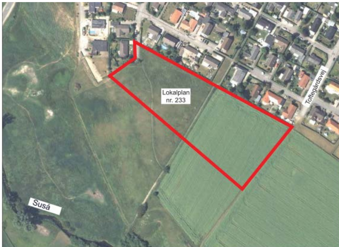
Lokalplanområde for boliger ved Susåen i Veterslev